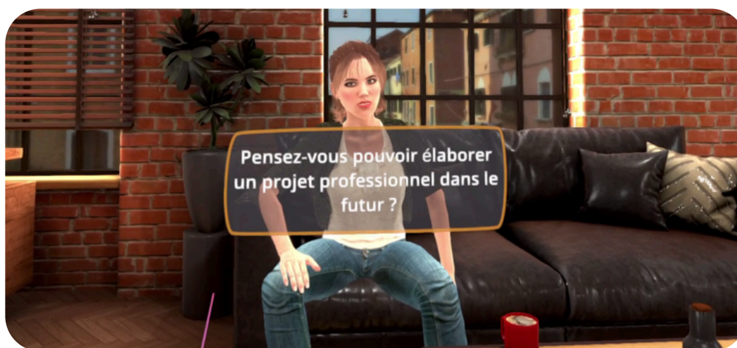
Visuel du simulateur VR: réussir son entretien

Le budget final dépend du nombre de participants, du niveau de personnalisation, de l'activation VR/PC, et des déplacements/logistique. Devis personnalisé sous 48 h ouvrées après cadrage.